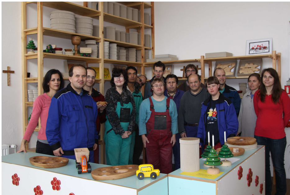
Pracovníci V růžovém sadu