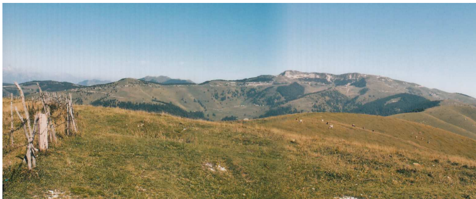
Pohled z Rakouských zákopů na Monte Asolone směrem k Italským liniím na protějším kopci. (V pozadí vrchol Monte Gappy, vlevo Monte Pertica.). Tady někde Václav Šenkýř padl.

Zatímco pro nás je už první světová válka dávno zapomenutou historií a málo kdo ví, kdo proti komu válčil, pro Italy je to pořád „La Grande guerra liberta“ (velká osvobozovací válka). Celý vrcholek Monte Grappy je proměněn v obrovský hojně navštěvovaný památník. Jsou zachována italská dělostřelecká postavení se spoustou vojenské techniky, na 5 km tunelů ve skále, nechybí muzeum války, památník, kostel a pohřebiště. Na něm odpočívá 12 615 italských vojáků, většinou bezejmenných. A také víc než 10 000 rakouských vojáků, rovněž bezejmenných. Jedním z nich je asi i pan Václav Šenkýř.